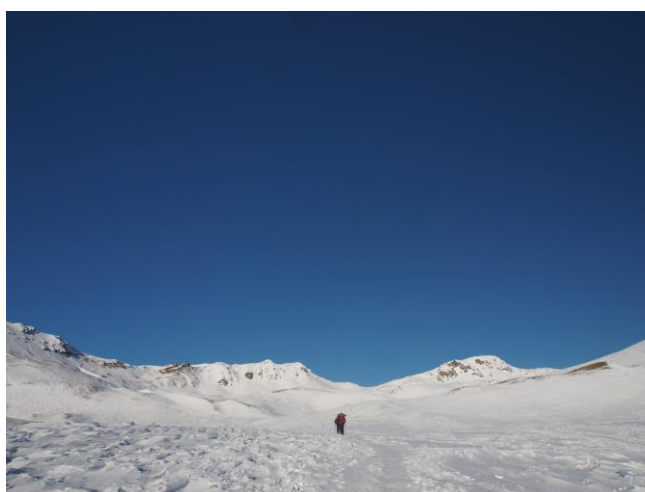
La parte finale con la cima

Il tracciato descritto è, per la salita, su traccia comune agli ciaspolatori e gli scialpinisti.