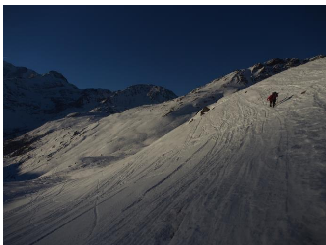
Il punto più delicato

Per quanto non indicato fare riferimento alla pagina 15 del libretto Programma Uscite 2019.